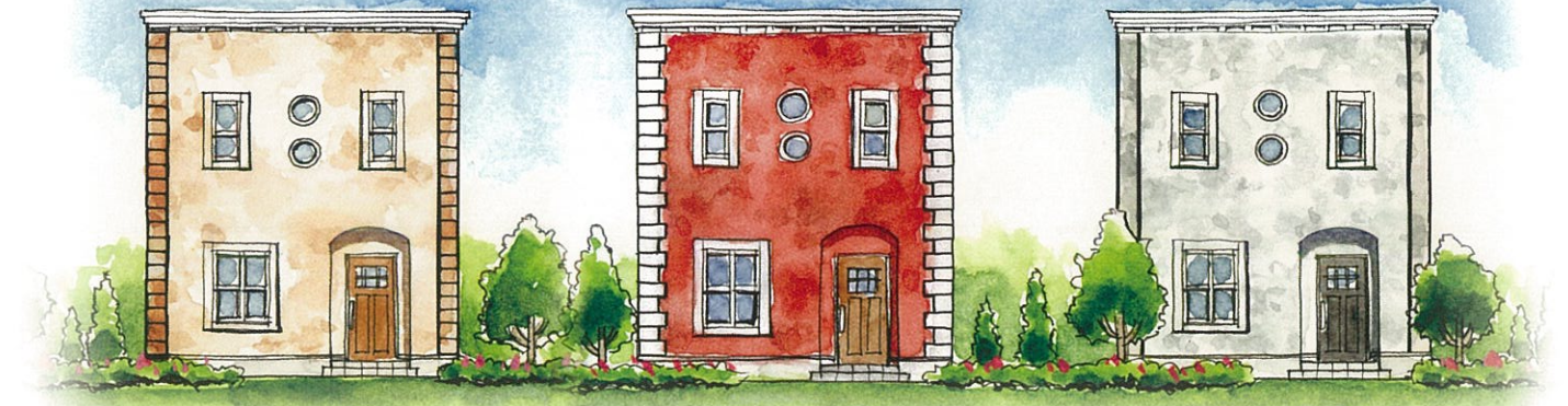
NEW YORKER Type-A